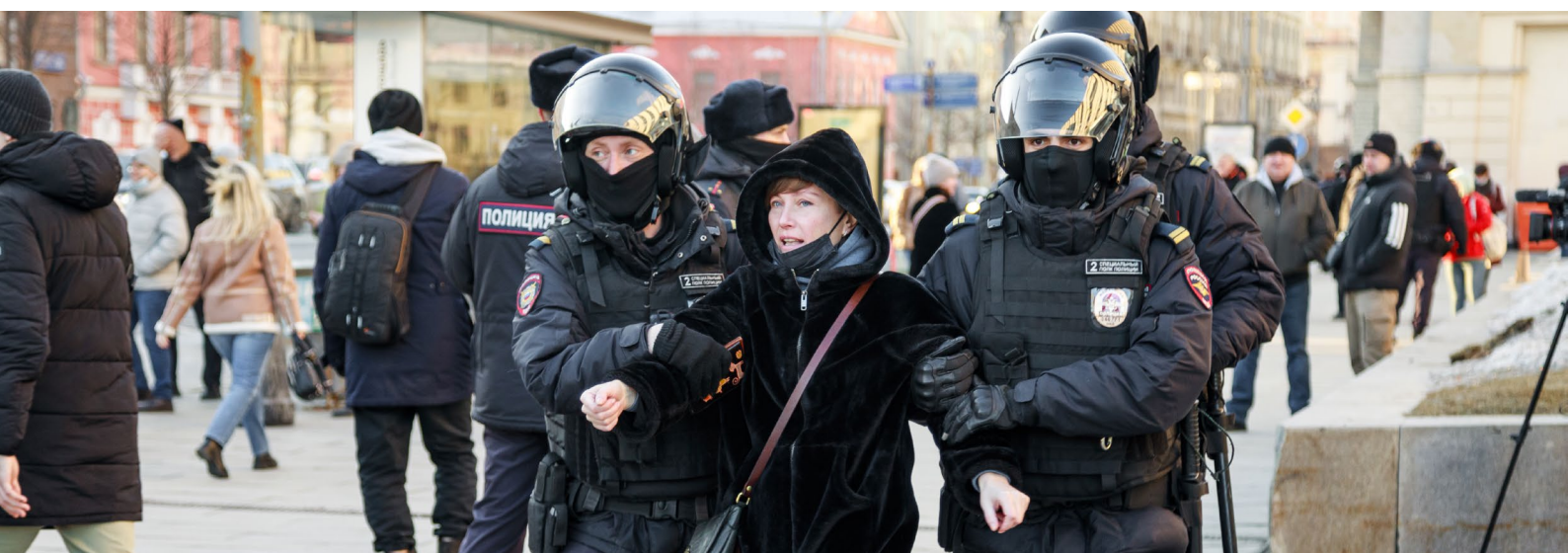
Москва, Россия - 7 февраля 2022 года: сотрудники полиции задерживают женщину на Пушкинской площади во время акции протеста против специальной военной операции.